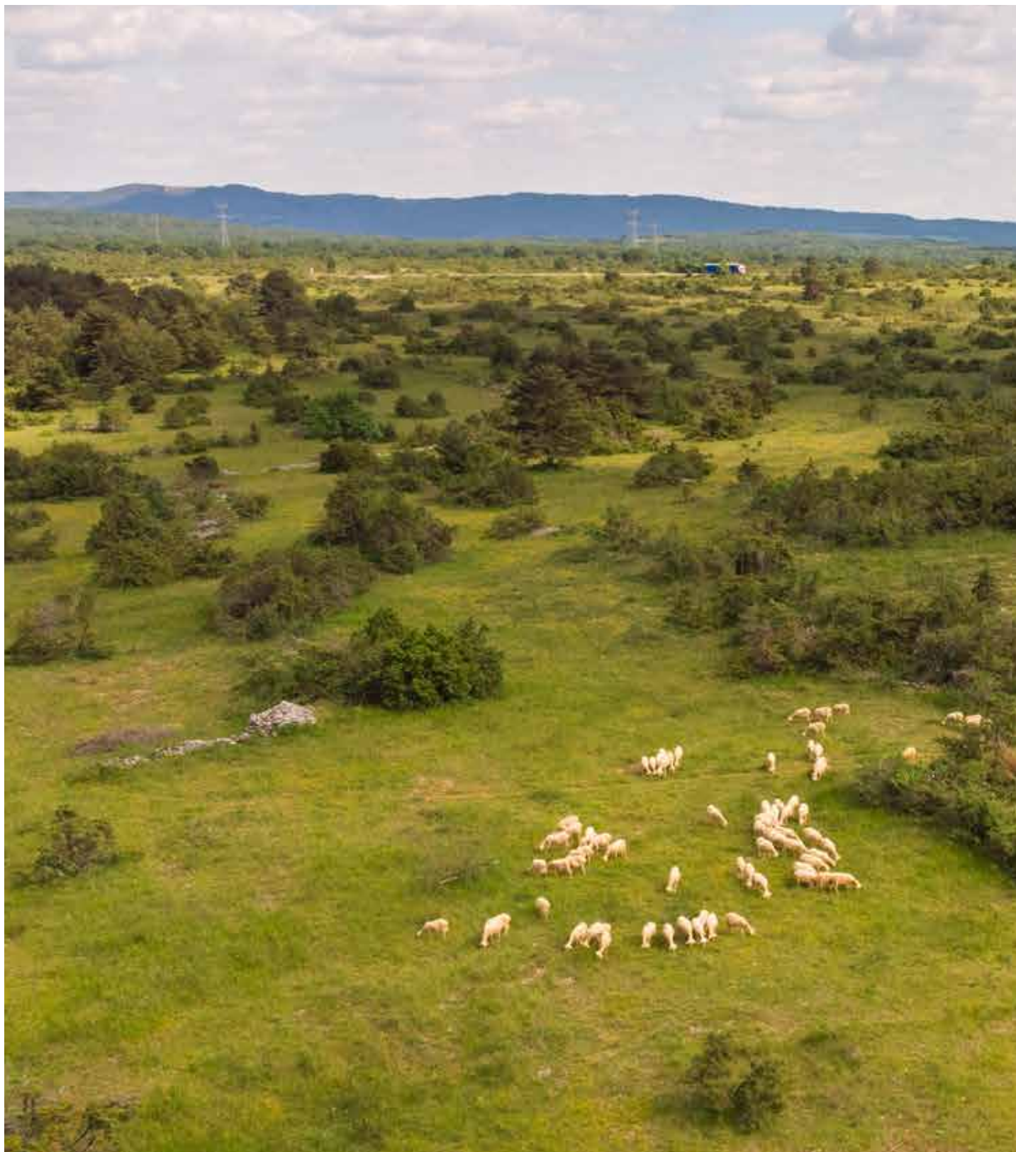
Aveyron Brebis Bio – Place de l'église – 12120 Arviu Std : 05 65 46 47 47 – www.aveyron-brebis-bio.fr